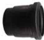
282 موفه کوتاه Short Expansion Joint+Oring PN=4bar