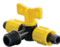
306 شیر سه راهی Triple Valve