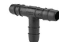
303 سه راه 16mm Tee