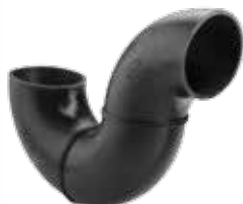
290 سیفون | Syphon PN=4bar