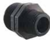
152 مغزی تبدیل