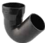
294 سیفون تبدیل | Reduced Syphon PN=4bar