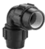
105 زانوی مساوی