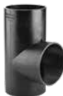
284 سه راه ۹۰° 90° Tee PN=4bar