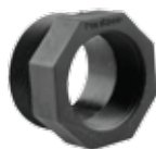
155 تبدیل نر / ماده