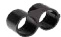
305 بست انتهایی End clamp