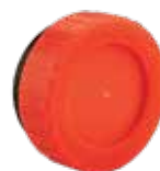
291 دریچه بازديد | Clean out with threaded Off take PN=4bar