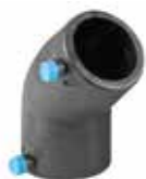
255 زانوی ۴۵° Elbow PN=16bar