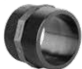
151 مغزی دنده ای