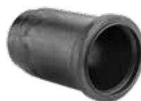
283 موفه بلند Long Expansion Joint+Oring PN=4bar