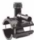
260 زین الکترو فیوژن Tee Tapping Saddles PN=16bar