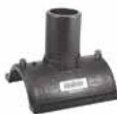
265 کمر بند الکترو فیوژن با خروجی استاندارد Saddles With Outlet PN=16bar