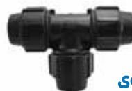
108 سه راه مساوی