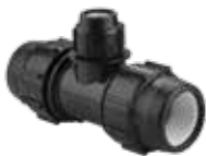
111 سه راه تبدیل