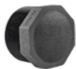
153 درپوش دنده ای