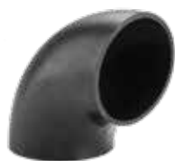
288 زانوی ۹۰° | 90° Elbow PN=4bar