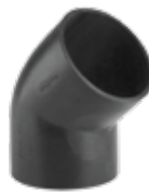
289 زانوی ۴۵° | 45° Elbow PN=4bar